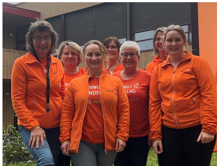
HUNT-teamet ønsker alle inviterte i Namsskogan velkommen til å delta!