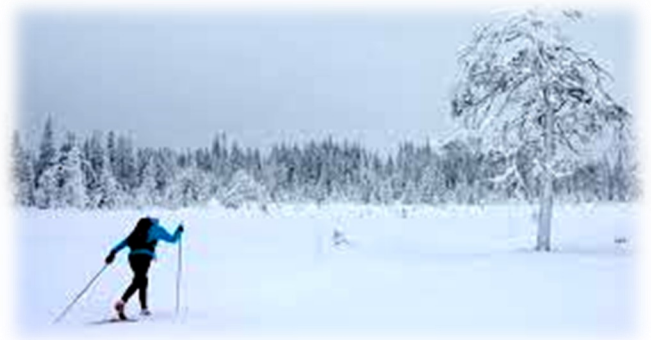
Gavekort fra Namsskogan Hotell