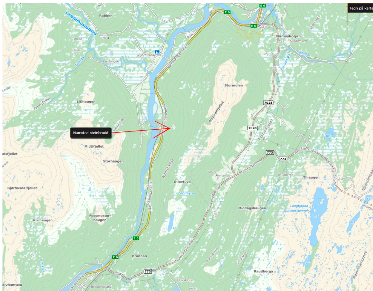
Kartutsnittet viser steinbruddets plassering rett øst for E6 mellom Brekkvasselv og Namsskogan sentrum.

Forslagsstiller har vurdert om planforslaget omfattes av krav om konsekvensutredning jf. forskriftens § 6. Arealet det her er snakk om er vesentlig mindre enn de 200 daa forskriften setter som grense, og uttaket ligger også vesentlig under forskriftens grense på 2 millioner m 3 masse. Planen faller inn under forskriftens vedlegg II 2 a) og § 8 a), det vil si planer som skal utredes om de har vesentlige virkninger for miljø og samfunn. Forslagsstiller konkluderer i sin vurdering med at planen ikke vil få vesentlige virkninger verken for miljø eller samfunn, og det er derfor ikke utarbeidet en egen konsekvensutredning til planforslaget.